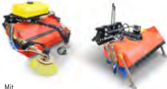
Mit Schmutzfangbehälter, Düsenprüheinrichtung und Seitenbesen