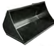
Erdschaufel rund für Kompaktlader

Stabile Erdschaufel für schwere Lasten und Erdarbeiten. Optional mit Reißzähnen, Fahrschutz und Wendemesser lieferbar.