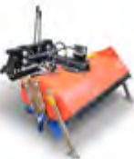
Mit Schnee-Kehrwalze, ohne Behälter