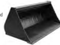
Erdschaufel rund für Rad- und Teleradlader