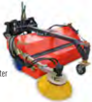
Mit Schmutzfangbehälter und Seitenbesen

Kehrmaschine mit Schmutzfangbehälter und hydraulischer Entleerung oder ohne Behälter erhältlich. Auf Wunsch auch mit Schnee-Kehrwalze (auch für Laub geeignet), Wasserbehälter mit Düsenprüheinrichtung und Seitenbesen, hydraulische Seiteneinstellung (inkl. Selektionsventil). Verschiedene Bürstendurchmesser möglich: 520 mm / 600 mm / 700 mm